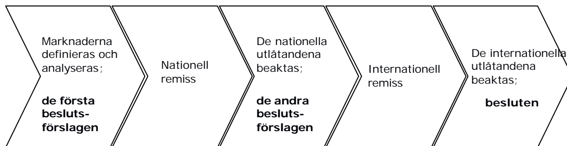
Figur 2: SMP-beslutens remissprocess